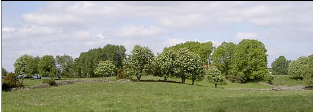
Paris - kan detta då vara platsen för slaget vid Fyrisvallarna ? För det var nog inte vid Fyrisån i Uppland denna strid utspelade sig, den ån hette Salaån ända fram till på 1600-talet

Strax invid Sätuna ligger Paris. Ortsborna själva kallar dock inte platsen för Paris utan Fárís, likaväl som man på sin lokala västgötadialekt säger kjarka istället för kyrka. I Paris finns väldiga vallar som sluttar ner mot Hornborgaån, som Slafsån här blivit omdöpt till, en å som för 1000 år sedan var betydligt mer imponerande än idag. Om en Parisbo skulle gå ner till ån så skulle han säga att vägen dit går över Farisvallarna.