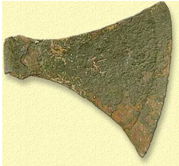
Skäggyxa funnen vid Hornborgasjön, i Hornborga socken ett par km norr Sätuna

Till Sätuna kunde man förr ta sig med båt, se under Skara . Idag ligger hamnen en bit bort från Hornborgasjön, men detta kan förklaras av landhöjningen, fem sänkningar av sjöns vattenstånd samt de senaste århundradenas utdikningar. Tidigare namn på Hornborgasjön har varit Lohne, Lonen och Lunden.