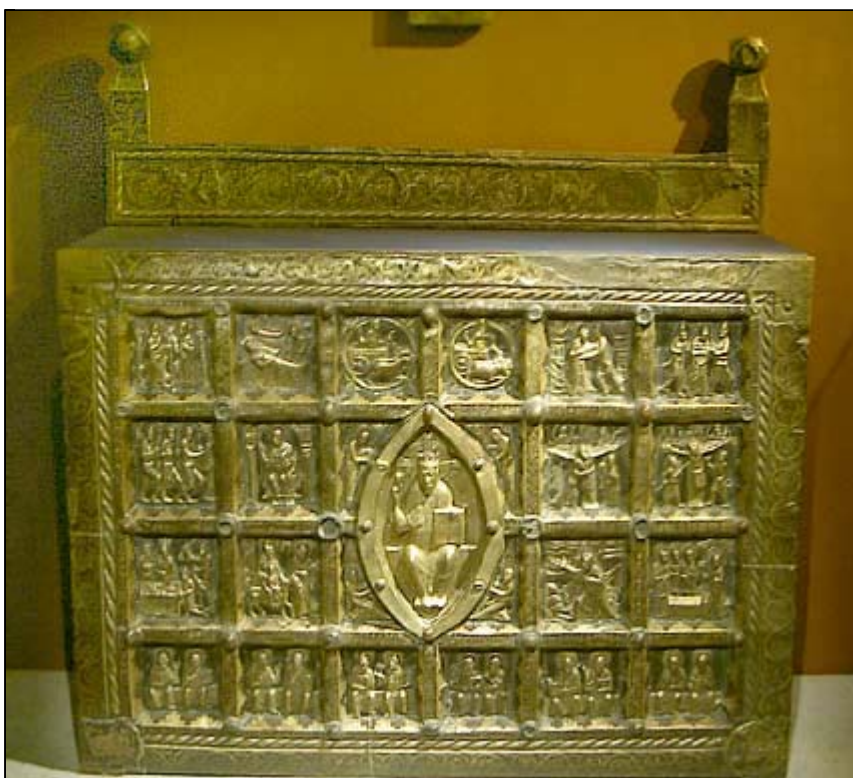
Det makalösa altaret som mycket väl kan ha tjänat som högaltare i Skara domkyrka

Det gyllene altare som stått i Broddetorps kyrka tros en gång ha fungerat som högaltare i Skara domkyrka , anskaffat dit från Jylland av biskop Bengt den gode på 1100-talet för att sedan troligen skänkas till Broddetorp av biskop Brynolf i början av 1300-talet i samband med att domkyrkan byggdes om.