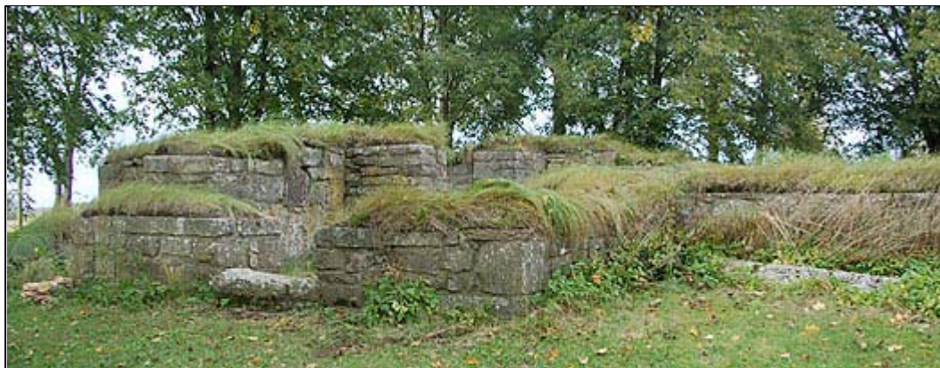
Ruinen av Hornborga kyrka sedd från söder med en stavkorshäll från 1100-talet t.h.

Hornborga kyrkoruin är belägen på en kulle i anslutning till egendomen Bosgården , strax norr om Hornborgaån. Kyrkan övergavs i början på 1800-talet då tornspiran blåste ner och skadade kyrkan.