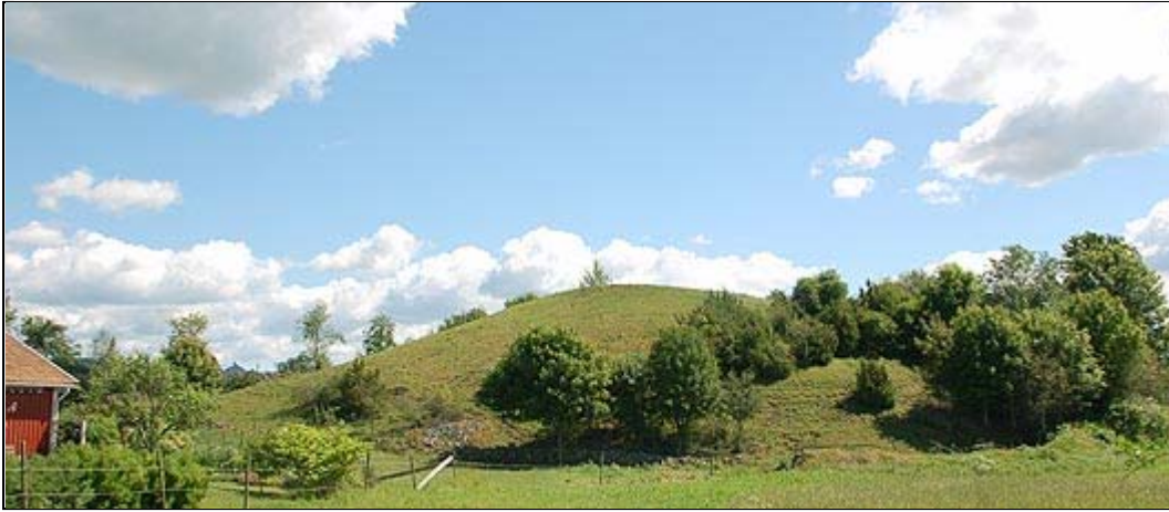
Rännehögen alldeles väster om Bosgården, totalt ca 50 m i diameter

På Almeö ca två km söder om Ytterberg finns en mycket märklig platå, ca 130x80 meter stor som påminner starkt om den platå där Gälakvist låg. Här har man funnit den berömda Almeöhunden, ca 9.000 år gammal.