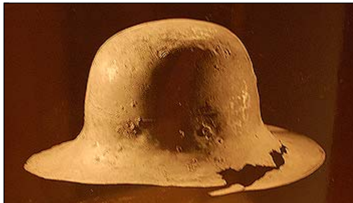
Stålhjälme (kittelhatt) från 1400-talet, funnen utanför Ytterberg

Ca 200 meter nordväst om Hornborga kyrka ligger Kungagraven som är en gånggrift i en hög, ca 27 x 22 m, men hela området åt väster mot Hornborgasjön är fylld med gravar - i söder ligger Odensängarna. I hornborga har man funnit en guldring från folkvandringstid - se den här .