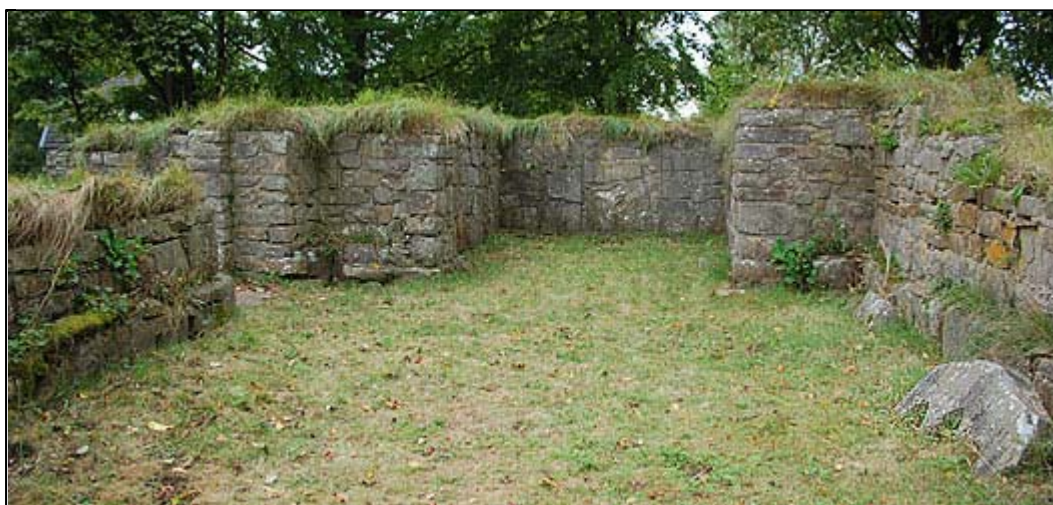
Kyrkan sedd från koret med ett vackert överstycke till tre smala spetsbågefönster nere t.h.