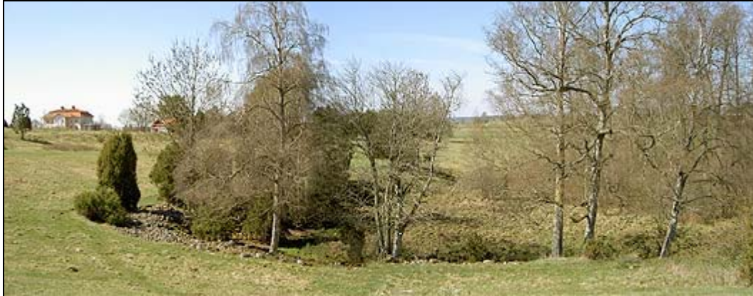
Sätuna hamn - männtro att någon grävt i den gamla hamnbassängen? Nä...