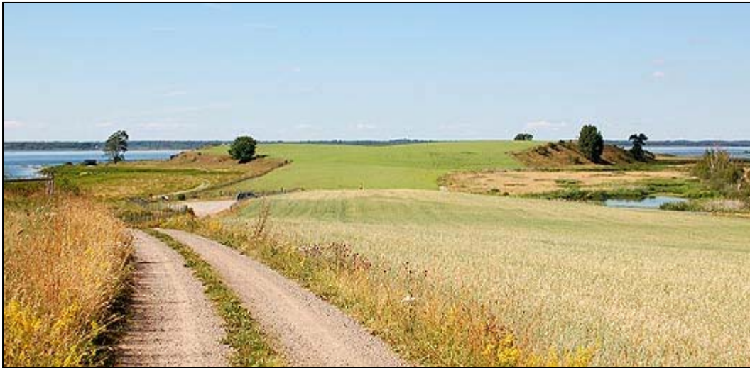
Ytterberg i sydöstra delen av Hornborgasjön där kung Inges slott sägs ha stått, borgen där ute på hornet - Hornborg...