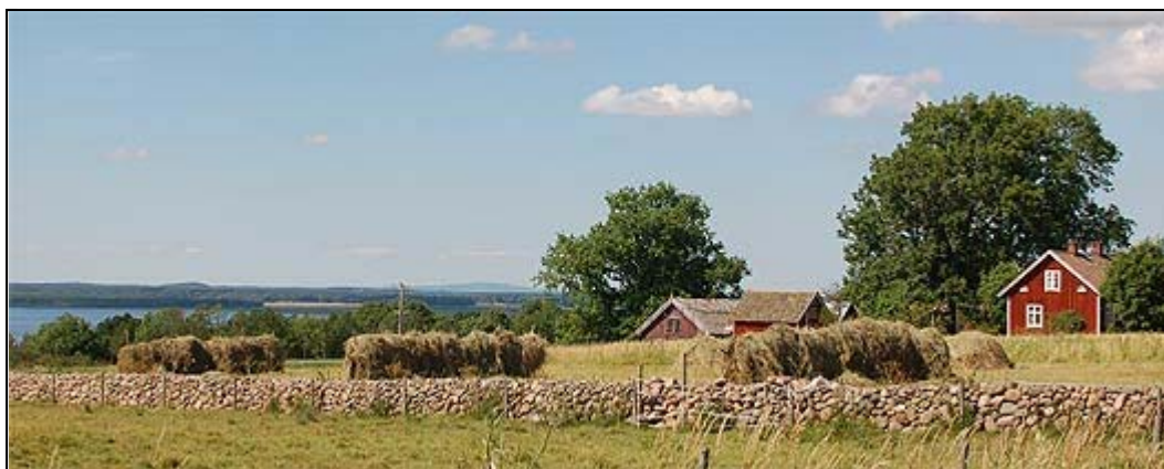
Heljesgården i Bolum ovan Hornborgasjön och Kinnekulle i fjärran, tre mil bort